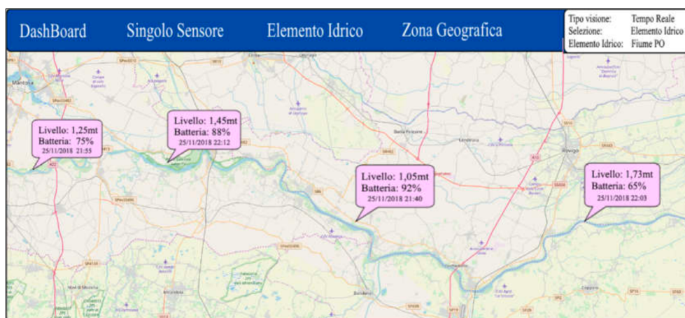
Schermata principale dell'interfaccia grafica